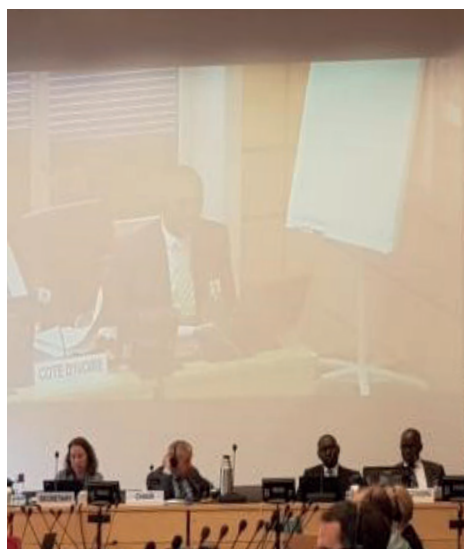
Comité de los Derechos del Niño en Ginebra

El BICE, en sus comunicaciones ante las instancias internacionales, interviene regularmente sobre las condiciones de privación de libertad de los NNA. Visión general desde mitad del 2018.