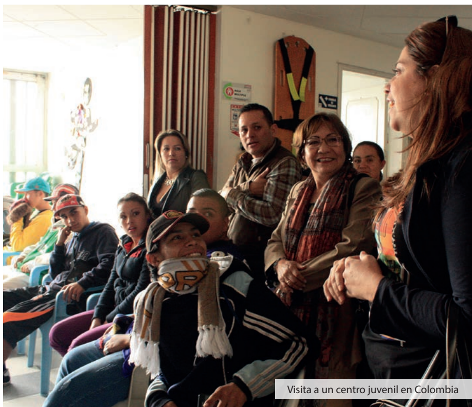
Visita a un centro juvenil en Colombia

En paralelo, principalmente en África, las asociaciones proporcionan un apoyo directo a los niños. En los países africanos de intervención, el 80 % de los NNA privados de libertad reciben apoyo en un marco provisional. Y esto, como alternativa