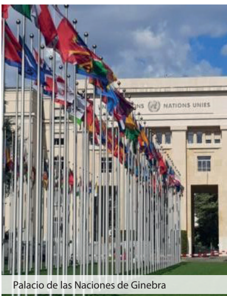
Palacio de las Naciones de Ginebra