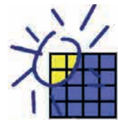
OPA - Niños Libres