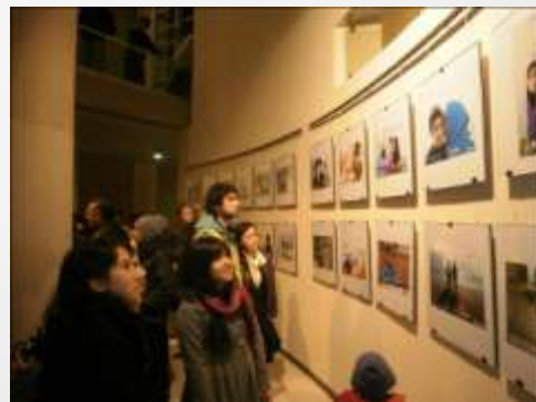
Día del lanzamiento de la muestra fotográfica realizada por los estudiantes, cada una de las fotos hace referencia a un derecho

Su objetivo específico es habilitar a niños, niñas, adolescentes y jóvenes de Colonias Urbanas para la prevención del maltrato infantil y la violencia social, mediante el fortalecimiento de factores protectores que promuevan conductas de autocuidado y buen trato haciendo ejercicio de sus derechos.